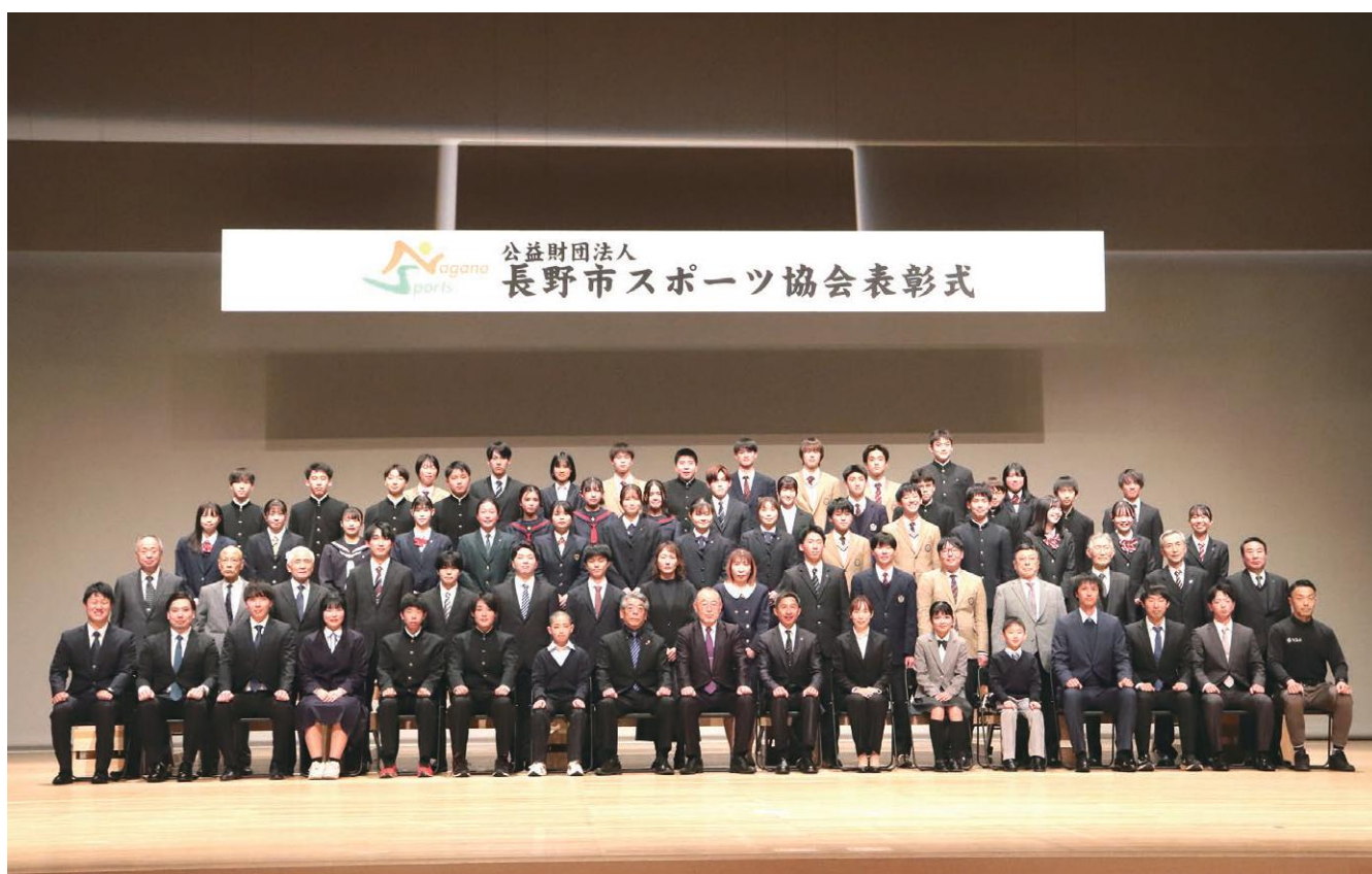
〈令和5年度公益財団法人長野市スポーツ協会表彰〉