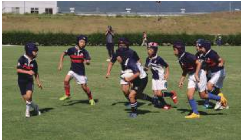
長野県スポーツ少年団競技別交流大会(ラグビー競技)