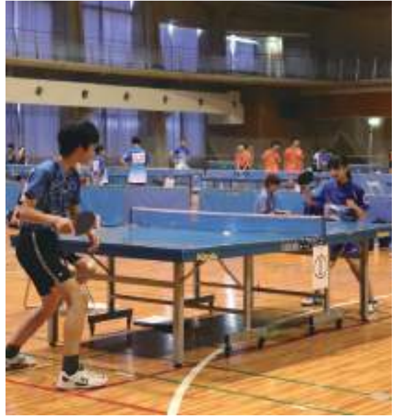
長野県スポーツ少年団競技別交流大会(卓球競技)