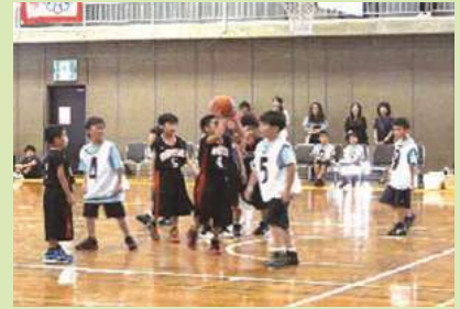
6/24(日)長野県スポーツ少年団北信地区競技別交流大会ミニバスケットボール競技(長野運動公園)