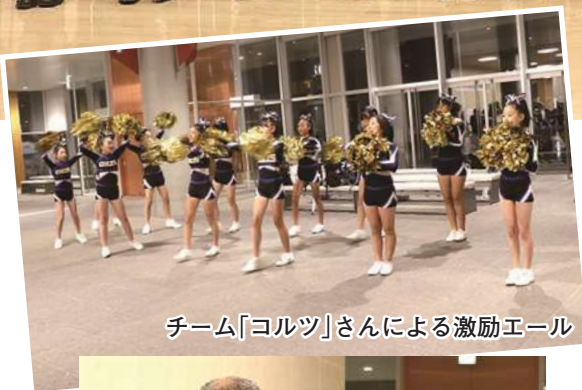
チーム「コルツ」さんによる激励エール