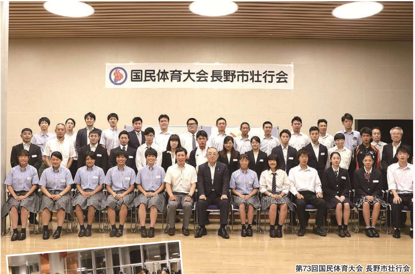
第73回国民体育大会 長野市壮行会