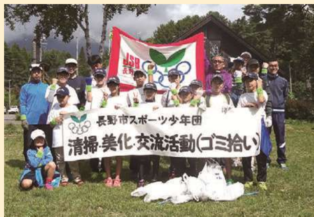
平成29年度活動の様子