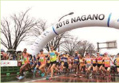
4/15(日)NAGANOマラソン大会 (長野運動公園～南長野運動公園)